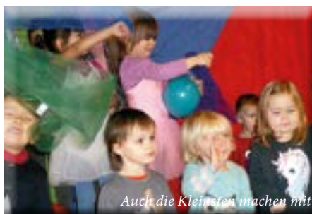
Auch die Kleinsten machen mit