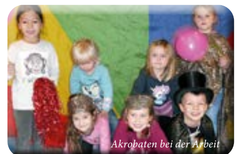
Akrobaten bei der Arbeit