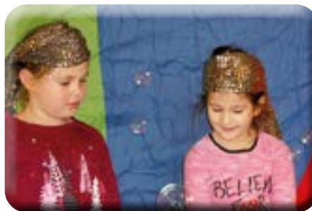
Unser Feuer ist entfacht