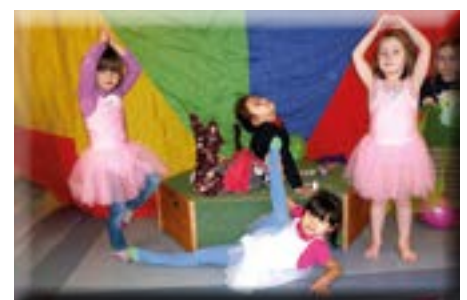
Auch die Tänzerinnen sind bereit