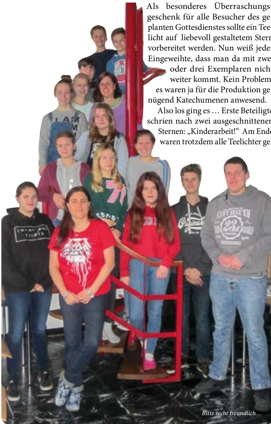
Bitte recht freundlich ...