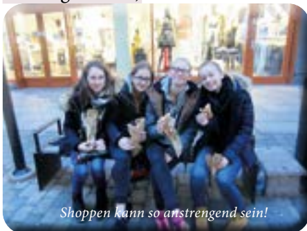
Shoppern kann so anstrengend sein!