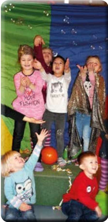
Spiel und Spaß