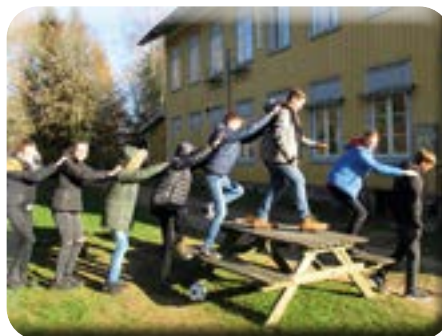
War das Teil der Spielebeschreibung?

stehen, aber es war doch sehr schön. Die Holzkirche im schwedischen Habo besichtigten wir auch; die Kirche war voller Ausmalungen, die alle irgend-