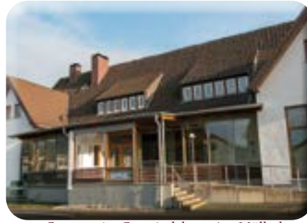
Gruppen im Gemeindehaus Am Müllerberg 4