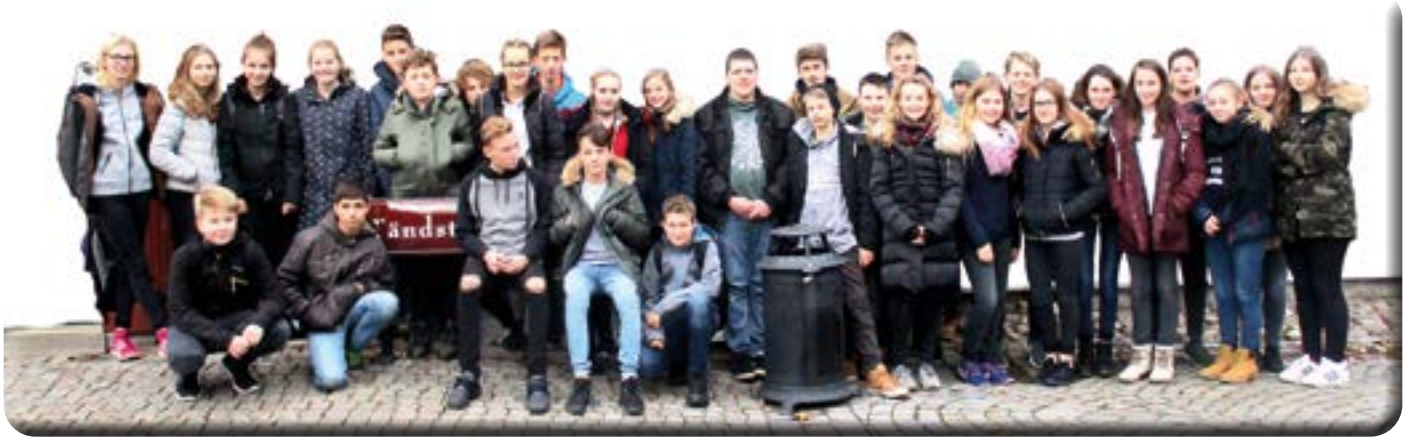
Ja, auch wir waren im Museum