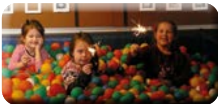
Unser Feuer ist entfacht