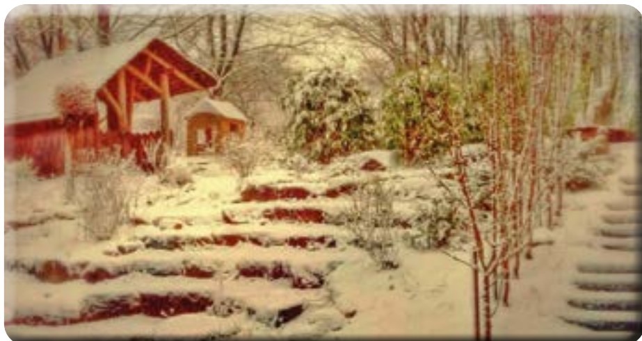
Außengelände der Kita Arche Noah im Winter