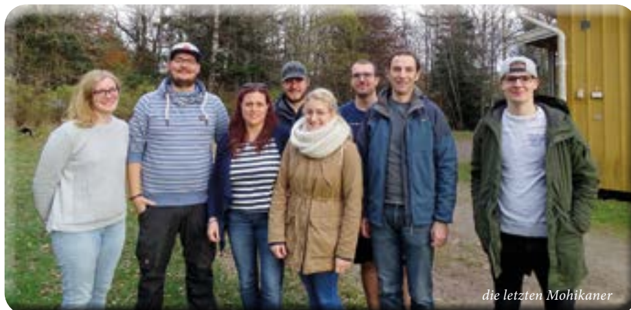
die letzten Mohikaner

aber auch immer so neugierige Fragen stellen müssen! Und nächstes Jahr ohne technisches Gerät im Kanu, denn Schweden ist ein ruhiges Land! Zum Glück ist niemand gekentert (... nur festgefahren am Grollemann-Gedächtnis-Unterwasser-Baum). Auf dieser Freizeit wurde es nicht langweilig, vor allem auch durch die Teamer, mit denen man immer Spaß hatte. Natürlich mussten wir auch Küchendienst (... und wehe wenn das Nutella auf unerklärliche Weise verschwunden ist! Dann setzt der Nutellastress ein!) machen und auch das Haus putzen. Dies wurde zugeteilt, so hatten manche weniger Glück und mussten die Toilette