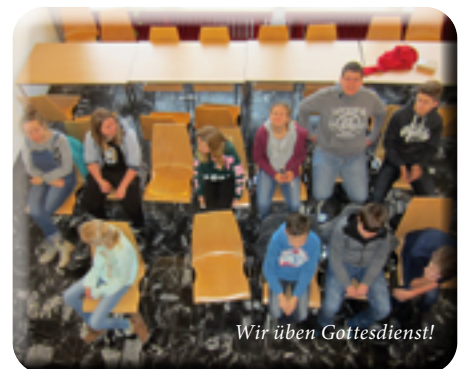
Wir üben Gottesdienst!