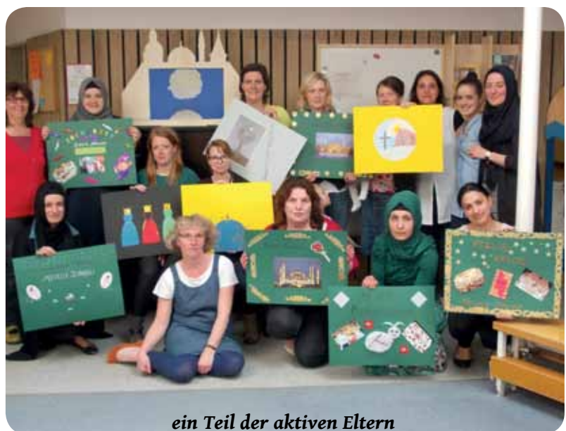
ein Teil der aktiven Eltern