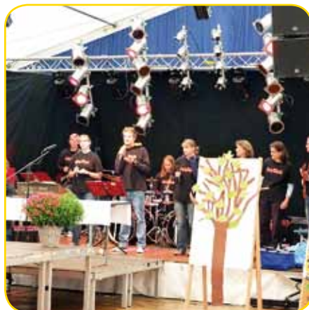
Die Band HOMESTATION