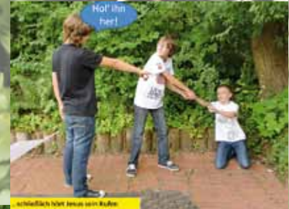
Schließlich hört Jesus zum Ruf: