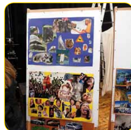
Kollagen der Katechumenen

ser für die zehn Milliarden Menschen vorhanden sein? Werden unsere Wälder dann durch Betonwüsten ersetzt sein?"