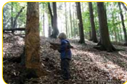
Hier gibt's jede Menge zu entdecken