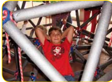
ganz schön entspannend so ein Museumsbesuch

11-Sitzer mit nur drei Rädern, der leider nie in Serienproduktion ging. Auch