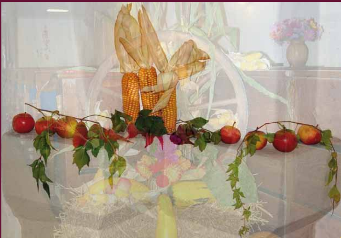
Zum Erntedankfest wird die Kirche besonders geschmückt (Seite 8)