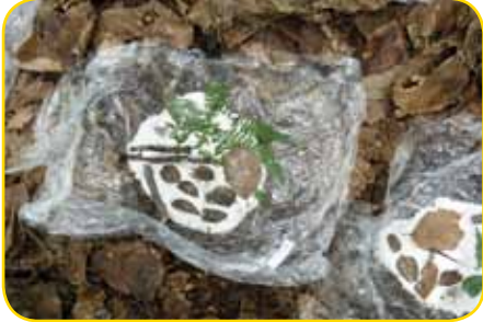
Kunst aus dem Wald

nur die Kinder nasse Füße riskierten. An unserem Waldplatz breiteten wir eine große Plane aus, um erst einmal in Ruhe zu frühstücken. Danach hieß es: „Pssst...“ – mit allen Sinnen in einem stillen Augenblick den Wald und die Natur wahrnehmen: