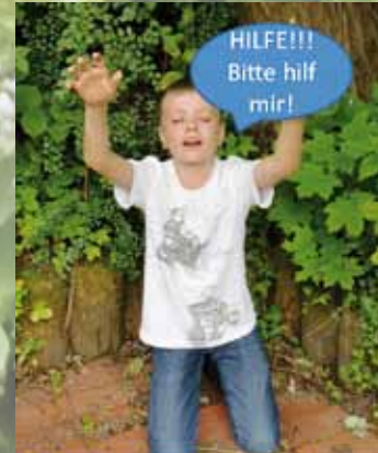
Bartimäus lässt sich nicht von den Leuten abwimmeln und zum Schweigen bringen...