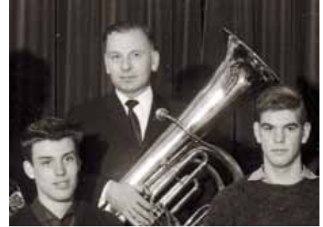
Probe am 12. März 1964

Texte, Lieder, die musikalische Gestaltung und die Begleitung durch den Posaunenchor. „Wie schön leuchtet der Morgenstern“, „Jerusalem, du hochgebaute Stadt“ und „Ja, ich will euch tragen, bis zum Alter hin“ – selbst in diesen letzten Verfügungen scheint der großartige Seelsorger durch, der sich selbst von Gott getragen wusste und in seinem Abschied für die Menschen „sorgen“ wollte, die zurückbleiben.