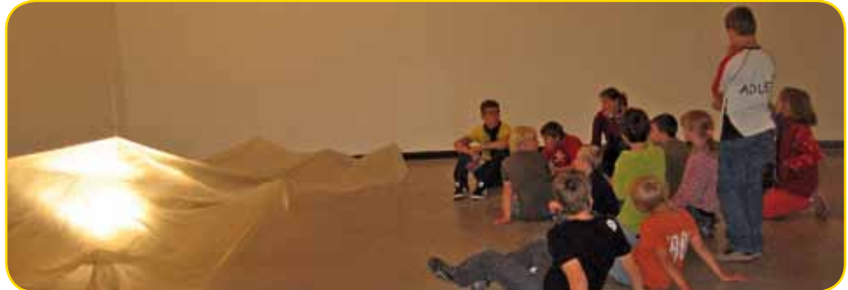
gespanntes Zuhören in der Ausstellung

11-Sitzer mit nur drei Rädern, der leider nie in Serienproduktion ging. Auch