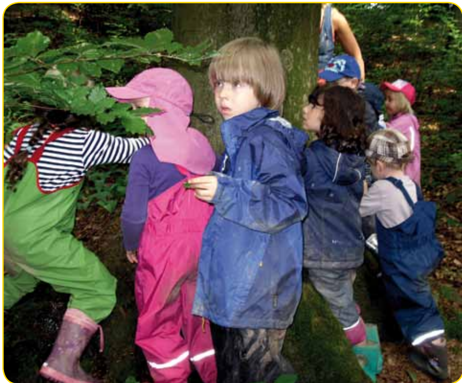
Wie viele Kinder braucht man um den Baum zu umfassen?

dort spannende Abenteuer. So kamen sie jeden Morgen an „Frau Linde“ vorbei, die stets freundlich begrüßt wurde, suchten sich einen „Waldhocker“ zum Frühstück, bekamen Besuch vom kleinen Waldzweig, spürten weiche, glatte oder harte Dinge, ließen sich von einem Ast zum Wippen einladen und erlebten Geschwindigkeit, wenn sie den Abhang laufend, rutschend oder sogar rollend hinunter sausten.