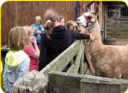
erstes vorsichtiges Beschnuppern

Doch langweilig „Nur Bilder anschauen“ war nicht angesagt! Da gab es z. B. den „Dymaxion Car #4“: ein