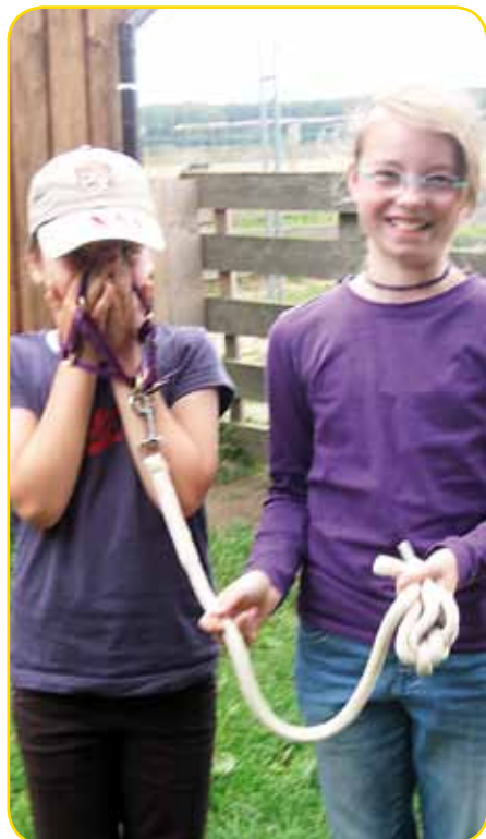
immer schön lieb