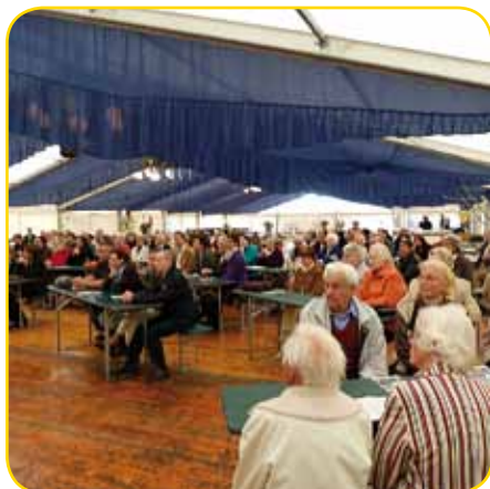
gut besuchter Zeltgottesdienst