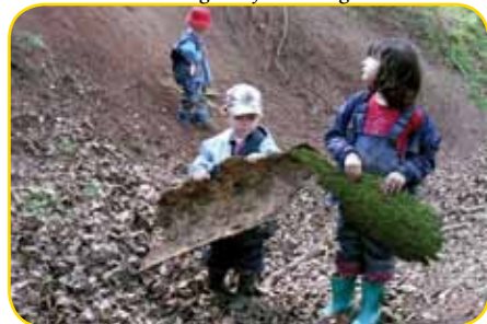
Kleine Forscher unterwegs

Für die Blaue und die Gelbe Gruppe bildeten sich mit Hilfe einiger Eltern Fahrgemeinschaften, um vom Kindergarten zum Parkplatz am Freibad zu kommen. Dort war der Treffpunkt für Erzieherinnen und Kinder. Alle da? Dann konnte es ja los gehen zu „unserem“ Waldplatz. Immer wieder gern wurde der Bach neben dem Weg genutzt, um zum Ziel zu kommen. Dann ging es hintereinander her, voller Spannung und „Kribbeln“ im Bauch, denn die Steine im Bach waren glitschig, wir mussten auch mal ins Ungewisse treten und gleichzeitig die Balance halten. So wurde der Weg zu einem spannenden und erlebnisreichen Abenteuer, bei dem nicht