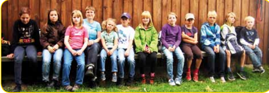
wir waren dabei