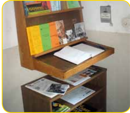
es findet sich manches zum Mitnehmen

Orgelspiel und Flötenkonzert“ / „...für ein gesundes, harmonisches und erfolgreiches Jahr“ / „...für einen Schutzengel“ / „...dass ich in schweren Stunden nicht allein war“ / „...dass Gott Mutti vom Leiden erlöst hat.“