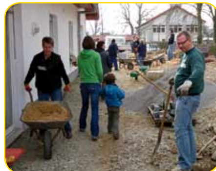
Hunderte Schubkarren wurden bewegt

Schneegestöber arbeiteten Kinder, Eltern und Erzieherinnen Hand in Hand. Das gemeinsame Schaffen machte allen sehr viel Spaß, und am Ende wurden unsere „Matschkinder“ mit dem Wasserschlauch abgespritzt. Seit 2006