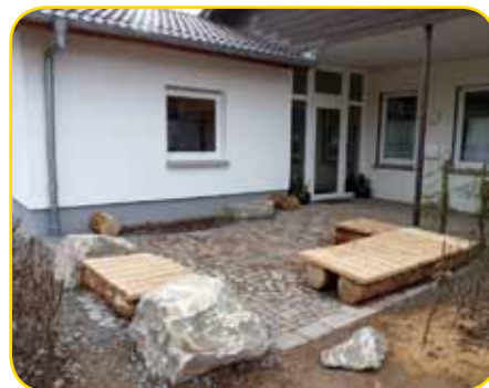
Ein Platz für Eltern

ke an den Hauswänden unserer Kita. Als schließlich eine stolze Summe an Spenden zusammen gekommen war, konnte im März 2006 der erste große Arbeitseinsatz stattfinden. Teilweise im