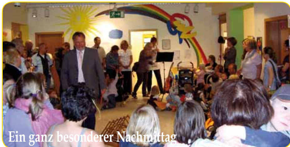
Ein ganz besonderer Nachmittag

Anlässlich der Einweihung der „Grünen Gruppe“ feierten die Kinder, Erzieherinnen, Eltern, Großeltern und viele Besucher einen Familiengottesdienst der besonderen Art im Foyer der Kindertagesstätte Regenbogen. Aus der Kita Regenbogen mit zwei Gruppen ist eine Kindertagesstätte mit drei Gruppen geworden, in der künftig auch Kinder unter drei Jahren betreut werden können. Diese neu entstandene „Grüne Gruppe“ wurde zum Ende des Gottesdienstes, der unter dem Motto „Vertrauen“ stand, mit dem obligatorischen Zerschneiden des Bandes feierlich eröffnet. Alle Besucher