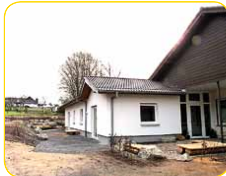
Der neue Eingangsbereich

den Anbau hierfür genutzt. Die Vorarbeiten fanden schon im Februar statt, mit einem Bagger wurden die großen Findlinge in die Erde gebracht. Die Kinder waren begeistert und nicht von den Fenstern der Kita weg zu bekommen. Auch als mehrere große LKW Sand, Schotter und andere Materiali-