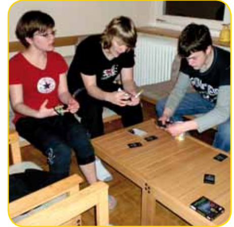
Wehe beim Wizar wird gemogelt!

Die Rettungsschwimmausbildung umfasste neben einem theoretischen Teil vorwiegend praktische Elemente, die aus verschiedenen Tauch- und Schwimmübungen, Personenrettung sowie Herz-Lungen-Wiederbelebung bestand. Die Ausbildung übernahmen die DLRG-Rettungsschwimmer, die ein straffes aber auch abwechslungsreiches und humorvolles Programm auf die Beine stellten.