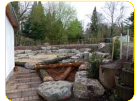
Der fertige Spielplatz

gepflanzt. Baumstämme wurden geschält und verarbeitet. So entstand ein Sandspielbereich, viele Klettermöglichkeiten aus Holz und Steinen und auch der Eingangsbereich der Kita erhielt ein neues Gesicht, mit Sitzgelegenheiten für wartende Eltern. Auch wenn bei den Helfern viel Schweiß ge-