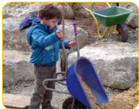
Auch unsere Kinder halfen mit werkstatt „Lebens(t)raum“ gestaltet.

Ende März war es soweit, der neu gewonnene Außenbereich für unter dreijährige Kinder an der Kita Arche Noah wurde gemeinsam mit Kindern, Eltern, Erzieherinnen und der Ideen-