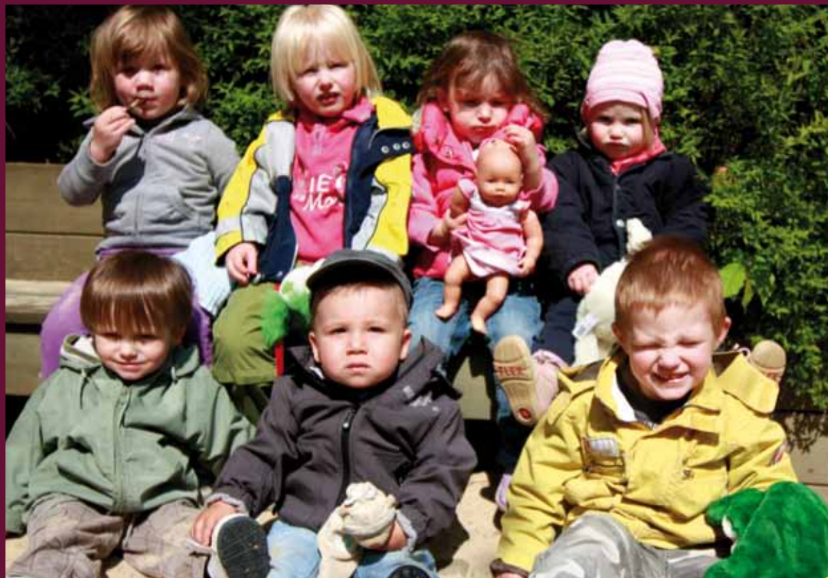
U3-Kinder während der Eröffnung ihres Bereichs in der Kindertagesstätte Regenbogen (Seite 18)