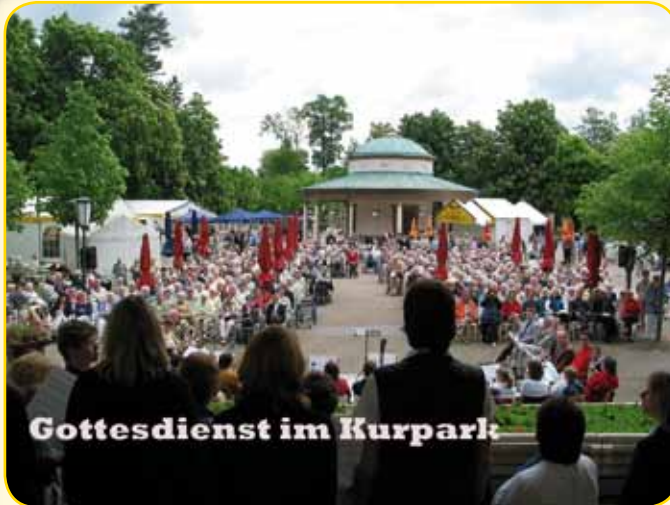
Gottesdienst im Kurpark

Einladung zum Ökumenischen Gottesdienst an Christi Himmelfahrt im historischen Kurpark in Bad Meinberg Donnerstag, 2. Juni, 10.00 Uhr