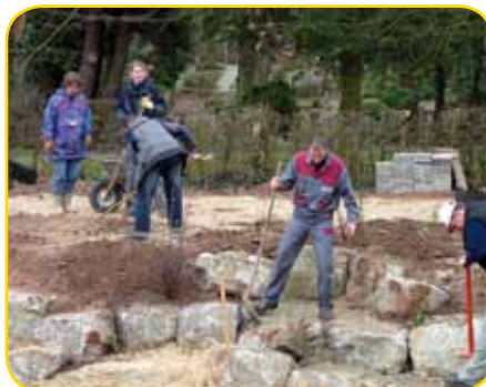
Hier noch mal Kind sein

nung aufnahm. Dann galt es Geldspenden für die Umsetzung zu sammeln. Erzieherinnen und viele fleißige Eltern gingen „Klinken putzen“. In der Zwischenzeit entstanden, in gemeinsamen Aktionen, schon Mosai-