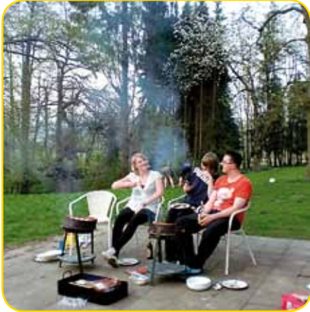
Grillen im Grünen