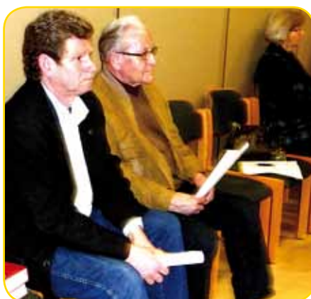
Zuhörer bei der Sitzung