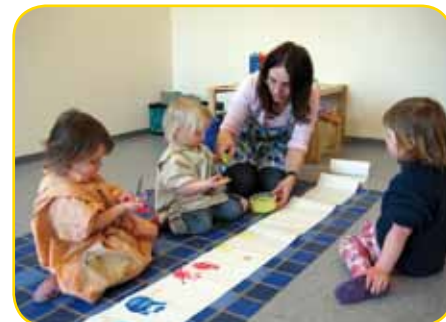
Raumgestaltung: Tapetenbordüre selbst hergestellt

Mitte, kommt der Frosch mit seinem Lied oder wir spielen mit unseren Fingern die Geschichte mit den 10 kleinen Indianern nach. Besonders beliebt ist unser Kreisspiel „Ritze, ritze, ratze wir schleichen wie die Katze...“ Zum Schluss darf sich ein Kind ein Gebet aussuchen und die Kerze in unserer Mitte auspusten. Danach ist der Popokreis beendet. Die neuen Lieder und die neuen Fingerspiele von uns und unseren Jüngsten hallen durch die ganze Einrichtung - Kindergartenkinder und unsere