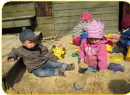
Spielen mit veränderten Alltagsgegenständen

dann schleicht sich auch schon die Müdigkeit ein. Einige werden schon vor dem Essen abgeholt, und die Tagesstättenkinder können und müssen sich nach dem Mittagessen in ihren Zwergebettchen ausruhen und schlafen.