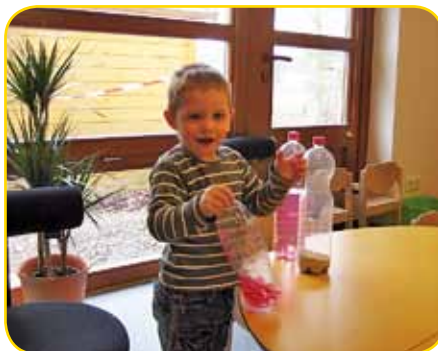
Spielen mit veränderten Alltagsgegenständen

In Wirklichkeit haben wir nur einen „richtigen“ Zwerg, der uns jeden Morgen im Popokreis begrüßt, dieser liegt in der gestalteten Mitte. Hier singen wir erst unser Begrüßungslied: „Halli, hallo, schön dass du da bist, halli, hallo, wir freuen uns ja so“... Dann wird er wach und begrüßt uns auf Zwergerart, gerne kitzelt er die Kinder mit seinem