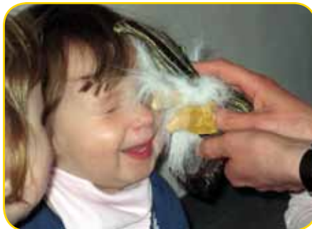
Oh, wie das kitzelt

Der Anbau ist fertig gestellt, die Möbel wurden mit viel Freude von den Kindergartenkindern aus der Blauen und Gelben Gruppe in die neue Grüne Gruppe getragen. „So kleine Stühle, da passen wir nicht mehr drauf!“ Uns kamen sie auch recht winzig vor. Und Eltern, die sich die Räumlichkeiten anschauten, hörten wir z.B. sagen: „Das sind ja Betten, wie bei Schneewittchen“. Ja, und bald würden die 7 Zwerge kommen. Am 01.03.2011 war es dann soweit, die Zwerge kamen, 10 an der Zahl im Alter zwischen 1,5-3 Jahre.