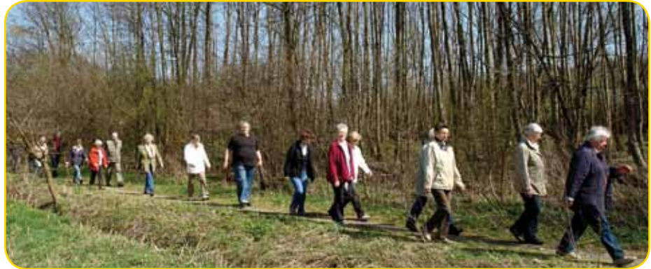
Hundertste Gemeindewanderung am 9. April: in langer Reihe durch den Moorstich