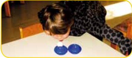
1, 2, 3 und los