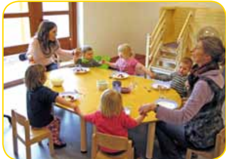
„Guten Appetit – hau rein!“

Das Frühstück ist für uns alle, groß und klein, immer wieder ein Erlebnis. Die Kinder probieren gerne mal was der Tischnachbar auf seinem Teller hat. Hier und da kippt auch mal der selbst-eingegossene Becher um, dann wird