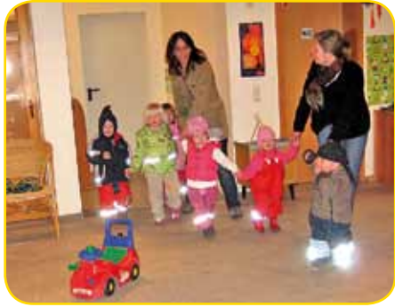
„Lange, lange Reihe, oh wie schön . . .“

ändert sich nur der Ort, zu dem wir als Gemeinschaft hingehen.