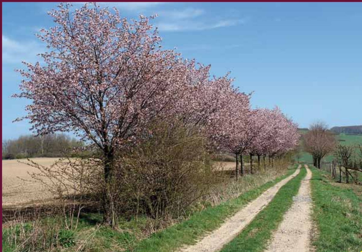
Während der Jubiläumsgemeindegewandlung am 9. April gesehen!