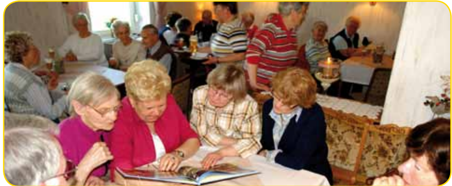
Hundertste Gemeindewanderung am 9. April: Rast im Heestener Krug