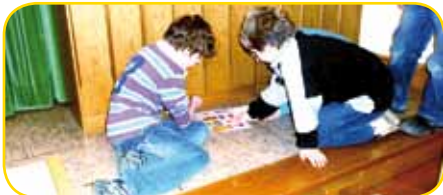
Wie war das jetzt mit den Flaggen?