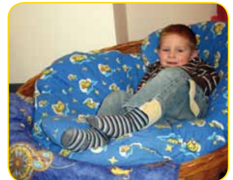
„Jetzt ist Kuschelzeit, wer kommt dazu?“