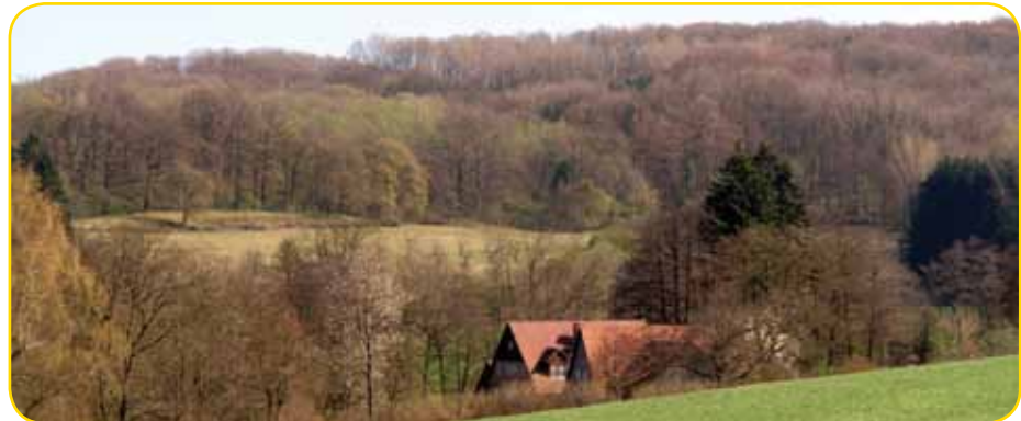
Hundertste Gemeindewanderung am 9. April: ehemalige Mühle am Silberbach