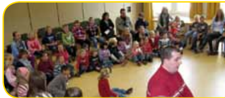
Unsere Gemeinde kommt in vielen Gruppen und Kreisen zusammen