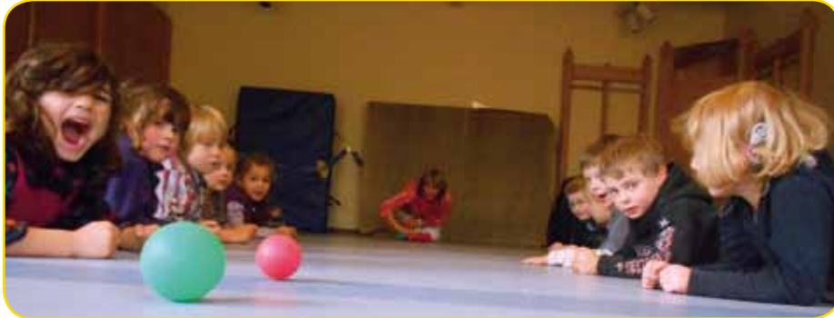
Bälle zählen und gleichzeitig eine Frage beantworten Wieviele Bälle sind es wirklich zum Schluss?