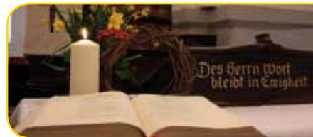
Unsere Gemeinde besteht aus Alten und Jungen, aus vielen Menschen mit unterschiedlichen Meinungen, Glaubenserfahrungen und Gaben. Was alle zusammenbringt, ist „des Herrn Wort, das in Ewigkeit bleibt“.