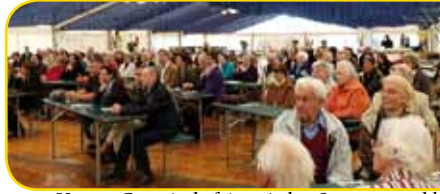
Unsere Gemeinde feiert jeden Sonntag und bei vielen anderen Gelegenheiten die großen Taten Gottes.

Ein ganz besonderes Jubiläum wird am 2. Advent (4. Dezember) im Gottesdienst festlich gefeiert: das 60jährige Bestehen des Singkreises (S. 20). Mit ihrer Musik haben die Sängerinnen und Sänger in vielen Jahren Brücken zu den Menschen gebaut und die Botschaft weitergetragen, die ihnen am Herzen liegt.