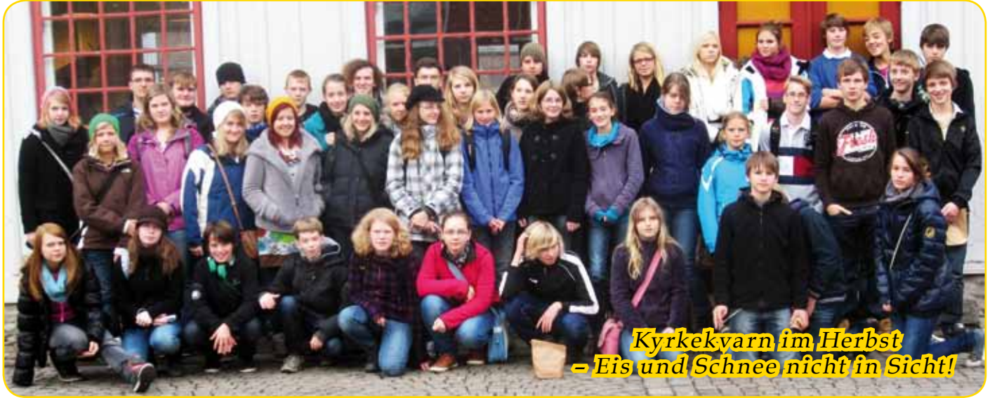
Kyrkekvarn im Herbst - Eis und Schnee nicht in Sicht!