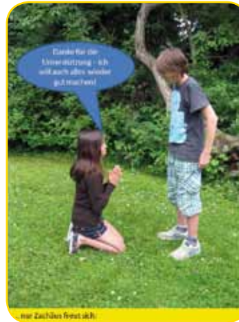
hier Zachäus freut sich!