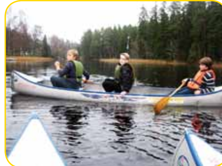
Achtung: Kanu kreuzt