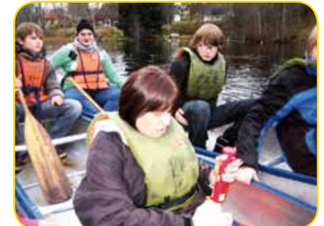
keine Kanutour ohne schwedische Verpflegung!