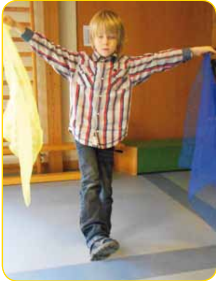
Arme und Beine gleichzeitig bewegen, ist schwierig