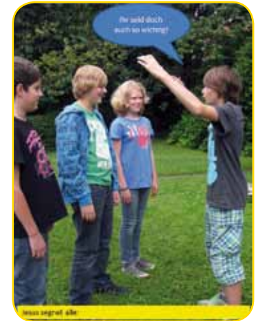
Jesus begrüßt alle