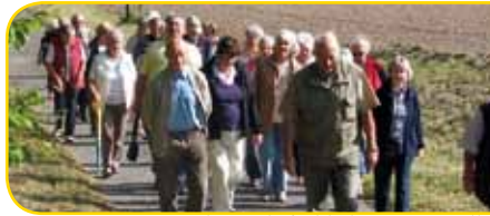
Unsere Gemeinde ist als fröhliches Gottesvolk unterwegs und sagt Dank für alle Dienste und Mitarbeit.