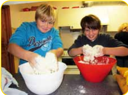
Pizzateigherstellung mit Muskelkraft