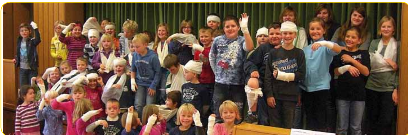
unter die Samariter geraten