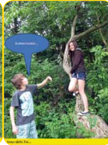
Jesus sieht ihn...