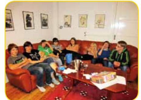
heiß begehrte Sofaecke

auf dem Programm, ohne Wasserschäden haben das alle Konfirmanden hinter sich gebracht. Am Dienstag konnten dann endlich die mitgebrachten schwedischen Kronen unter die Leute gebracht werden. Die einen konnten gar nicht genug ausgeben, andere dagegen hatten eher Probleme an Geld