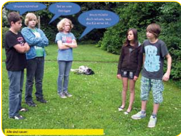
Alle sind sauer: