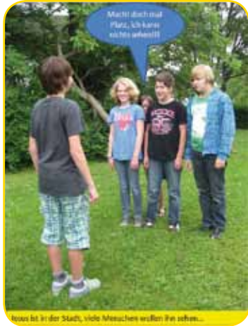
Jesus ist in der Stadt, viele Menschen wollen ihn sehen...