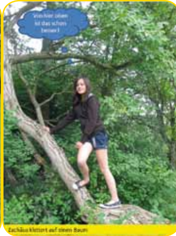
Zachäus klettert auf einen Baum